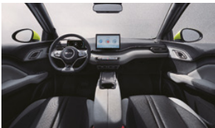
Black and grey